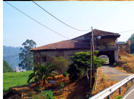
Palacio de Los Francos, Quinzanas (Pravia)