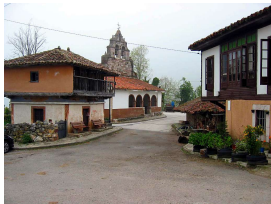
Villabre, capital del concejo de Yernes y Tameza

Publicado por Cicloturismo - 06 Abr 2014 14:00