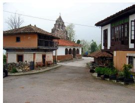
Villabre, capital del concejo de Yernes y Tameza

Publicado por Cicloturismo - 06 Abr 2014 14:00