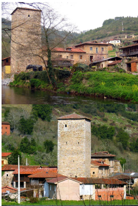
Torre de Villanueva, Grado, Asturias

Partiremos desde la estación FEVE de Grado, en dirección Tameza, rodando a través de una agradable senda-paseo que nos arrojará directamente a la carretera AS-311 a la altura de Rodanco. Carretera que, por cierto, nos acompañará en gran parte de nuestra ruta, por no decir toda.