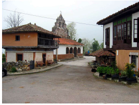
Villabre, capital del concejo de Yernes y Tameza

Publicado por Cicloturismo - 06 Abr 2014 14:00