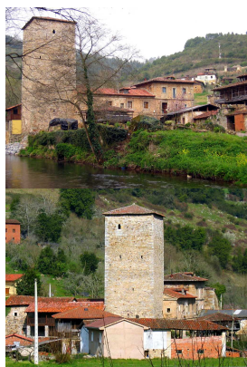
Torre de Villanueva, Grado, Asturias

Partiremos desde la estación FEVE de Grado, en dirección Tameza, rodando a través de una agradable senda-paseo que nos arrojará directamente a la carretera AS-311 a la altura de Rodanco. Carretera que, por cierto, nos acompañará en gran parte de nuestra ruta, por no decir toda.