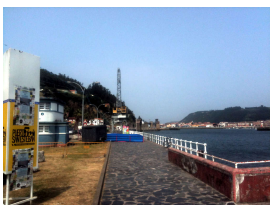
Puerto de San Esteban de Pravia

Después iremos dirección Muros de Nalón y de allí a visitar el mirador y la capilla del Espíritu Santo, bonito balcón sobre el mar y la desembocadura del Nalón.