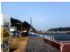
Puerto de San Esteban de Pravia

Después iremos dirección Muros de Nalón y de allí a visitar el mirador y la capilla del Espíritu Santo, bonito balcón sobre el mar y la desembocadura del Nalón.