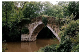
Puente del bajomedievo en Brañes

Publicado por Cicloturismo - 30 Mar 2014 15:59