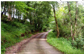
Bosque de Cantarranas

Comenzamos en la estación de tren de La Corredoria y empezaremos subiendo por Cuyences. Enseguida nos adentramos en zona rural por caleyas y nos encontraremos la primera fuente. Más adelante, por desgracia, el paisaje bucólico se desfigura con las Canteras del Naranco. En la intersección seguimos dirección Ladines (Lladines). Pasaremos por Quintana, donde hay una fuente-lavadero y más adelante, en Folgueras, aprovecharemos para hacer una parada en su fuente.