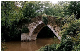
Puente del bajomedievo en Brañes

Publicado por Cicloturismo - 30 Mar 2014 15:59