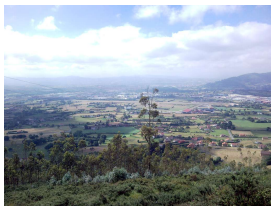
Dominios de Llanera desde el Santo Firme

Publicado por Cicloturismo - 23 Mar 2014 14:59