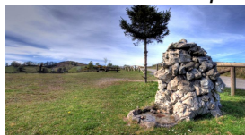
Área recreativa de La Camperona

Saldremos de El Entrego para en el PK. 2 tomar la senda verde de Carrocera , sitio precioso entre árboles y con frescor. Lamentablemente no es muy larga y, casi al final de la misma, nos tenemos que salir a la comarcal AS-338 para subir al pueblín de