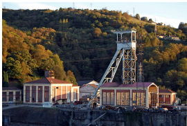
Castillete Pozo Candín II, La Felguera

Una vez que lleguemos arriba —PK. 8, donde la parada del bus— veremos que, en el lado izquierdo de la carretera por la que hemos subido hay un bar de mismo nombre que el pueblo. Este será el punto de concentración para esperar a los demás participantes de la ruta mientras picamos algo, con alguna que otra sorpresa; como una secretaria que, a lo mejor, quiere demostrarnos sus dotes.