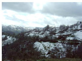
Subida a La Camperona nevada

La ruta pasa por los concejos de Langreo y Mieres, zonas de gran actividad carbonífera en otros tiempos . En la actualidad disfrutaremos de los paisajes heredados y podremos comprobar como la vegetación disimula lo que antes fueron bocaminas, escombreras e infraestructuras mineras —resulta asombroso el poder restaurador de la naturaleza—. No obstante aún quedan restos de castille tes y se conservan algunas edificaciones de antiguas minas (oficinas, escuelas, casa de Los Felgueroso , etcétera), destacando entre todas estas construcciones la central eléctrica con su gran chimenea de ladrillo.