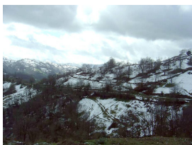
Subida a La Camperona nevada

La ruta pasa por los concejos de Langreo y Mieres, zonas de gran actividad carbonífera en otros tiempos . En la actualidad disfrutaremos de los paisajes heredados y podremos comprobar como la vegetación disimula lo que antes fueron bocaminas, escombreras e infraestructuras mineras —resulta asombroso el poder restaurador de la naturaleza—. No obstante aún quedan restos de castille y se conservan algunas edificaciones de antiguas minas (oficinas, escuelas, casa de Los Felgueroso , etcétera), destacando entre todas estas construcciones la central eléctrica con su gran chimenea de ladrillo.