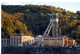
Castillete Pozo Candín II, La Felguera

Una vez que lleguemos arriba —PK. 8, donde la parada del bus— veremos que, en el lado izquierdo de la carretera por la que hemos subido hay un bar de mismo nombre que el pueblo. Este será el punto de concentración para esperar a los demás participantes de la ruta mientras picamos algo, con alguna que otra sorpresa; como una secretaria que, a lo mejor, quiere demostrarnos sus dotes.