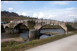
El puente Romanón o Puente Viejo, Lugones

Volviendo a nuestra ruta, el Puente Romanón o Puente Viejo cerca de Lugones, medieval con tres arcos apuntados de diferente tamaño y calidad. Este puente daba paso al camino que desde el centro de Asturias corría hacia el oriente, en principio de origen romano, luego medieval y moderno, y usado por los habitantes de Siero hasta hace pocos años.