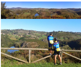
El Nora a su paso por Priañes

El río Nora es uno de los afluentes más largo de Asturias (67Km), antes de ceder sus aguas al río Nalón. Nace en Valvidares (Sariego), y sigue por los concejos de Siero y Noreña. En sus kilómetros finales, sirve de frontera natural entre los concejos de Oviedo y Llanera primero, y entre Oviedo y Las Regueras después. Desemboca en el Nalón entre los núcleos de población de Priañes (Oviedo), Santa María de Grado (Grado) y Tahoces (Las Regueras). Cerca de su desembocadura, en lo que se conoce como Meandros del Nora, zona paisajística de singular belleza, se encuentra la presa del embalse de Priañes.