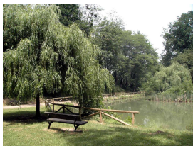
Área recreativa de Santa Bárbara, Lugones

SALIDA: domingo 16 de marzo de 2014, 10:15 hrs. desde Estación RENFE Lugo de Llanera .