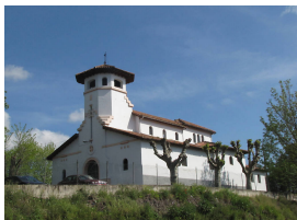
Iglesia de Santa Eulalia, Colloto