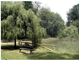
Área recreativa de Santa Bárbara, Lugones

SALIDA: domingo 16 de marzo de 2014, 10:15 hrs. desde Estación RENFE Lugo de Llanera .