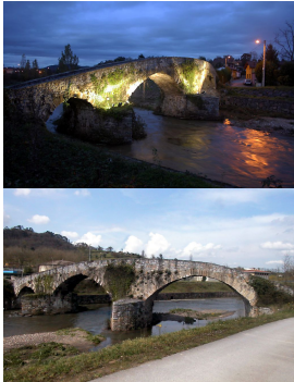
El puente Romanón o Puente Viejo, Lugones

Volviendo a nuestra ruta, el Puente Romanón o Puente Viejo cerca de Lugones, medieval con tres arcos apuntados de diferente tamaño y calidad. Este puente daba paso al camino que desde el centro de Asturias corría hacia el oriente, en principio de origen romano, luego medieval y moderno, y usado por los habitantes de Siero hasta hace pocos años.