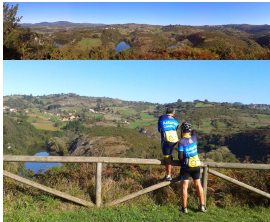
El Nora a su paso por Priañes

El río Nora es uno de los afluentes más largo de Asturias (67Km), antes de ceder sus aguas al río Nalón. Nace en Valvidares (Sariego), y sigue por los concejos de Siero y Noreña. En sus kilómetros finales, sirve de frontera natural entre los concejos de Oviedo y Llanera primero, y entre Oviedo y Las Regueras después. Desemboca en el Nalón entre los núcleos de población de Priañes (Oviedo), Santa María de Grado (Grado) y Tahoces (Las Regueras). Cerca de su desembocadura, en lo que se conoce como Meandros del Nora, zona paisajística de singular belleza, se encuentra la presa del embalse de Priañes.