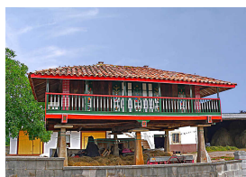
Panera en Cenero

¡Quien venga, tendrá que besar al gochín en el morrín!