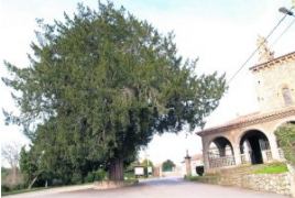
e San Juan Bautista en Cenero