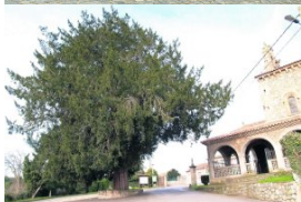
e San Juan Bautista en Cenero