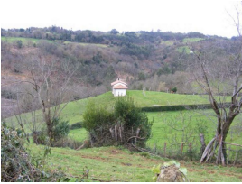
Solitaria Ermita de San Ananías (Huergo)