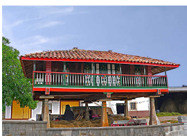
Panera en Cenero

¡Quien venga, tendrá que besar al gochín en el morrín!