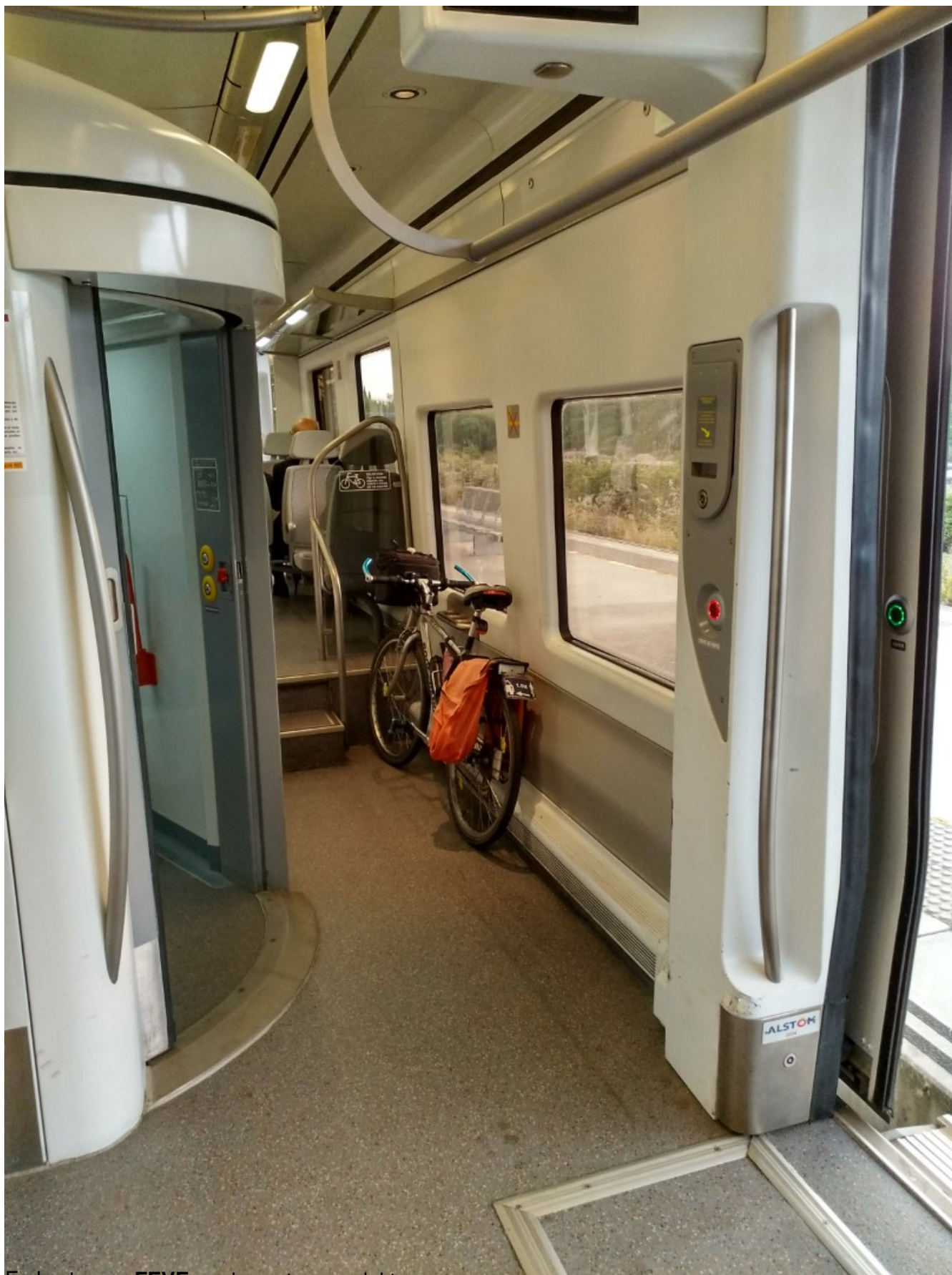
En los trenes FEVE , en los extremos del tren