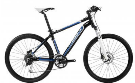
Bici 2. BH Peak

Por e-mail nos llegan noticias de otra #BiciRobada . En este caso no solo se trata de una bicicleta, sino que son dos las que se han llevado, en proceso de denuncia, entre el