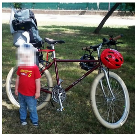
Specialized Hard Rock restaurada

Publicado por acb_web - 07 Dic 2014 06:20