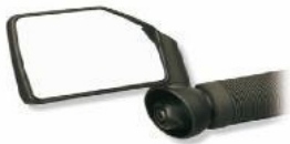
Espejo Zefal Dooback

Publicado por acb_web - 16 Nov 2011 10:45