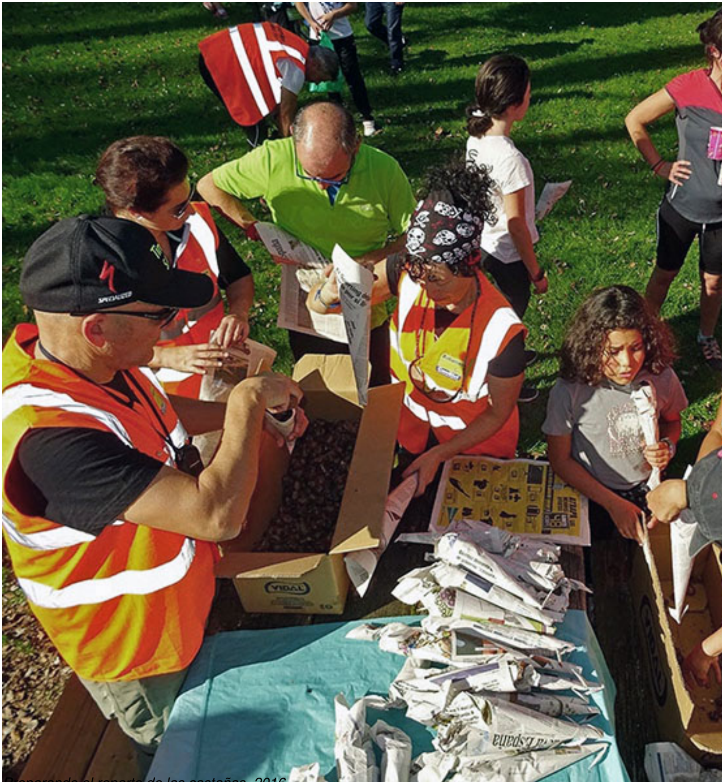
Preparando el reparto de las castañas, 2016 ¿Es obligatorio apuntarse en algún sitio?

NO, no es obligatorio apuntarse previamente