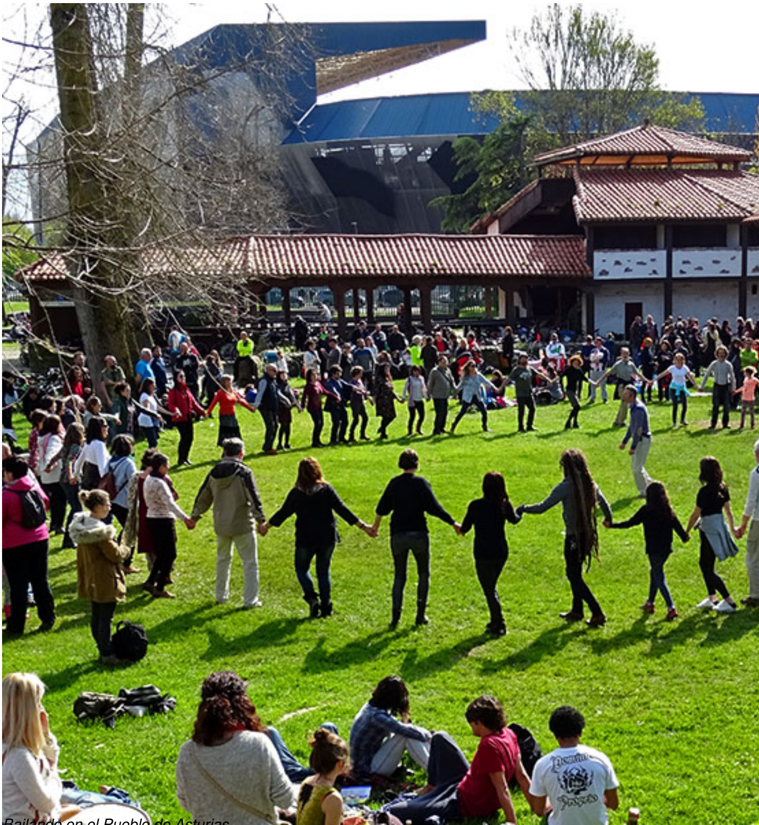
Bailando en el Pueblo de Asturias