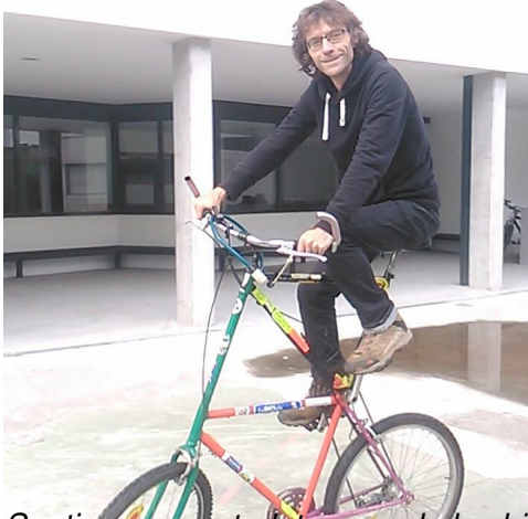
Santiago es un todoterrano de las bicicletas