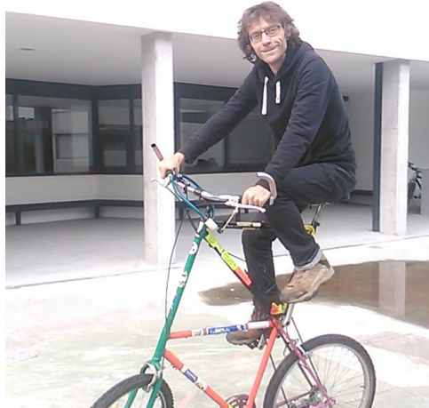
Santiago es un todoterrero de las bicicletas