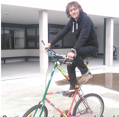
Santiago es un todoterrero de las bicicletas