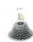
Ejemplo piñón de 9 coronas.

En los citados ejemplos de dibujos aunque el de la izquierda tiene menos coronas y el derecha tiene mas, con lo que he explicado ¿cuál creéis que conviene más a primera vista para hacer cicloturismo?