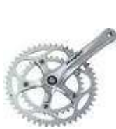
Ejemplo de biela de 2 platos.

El plato pequeño es el que va más metido en el cuadro.