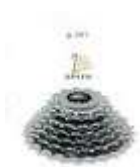
Ejemplo piñón de 7 coronas