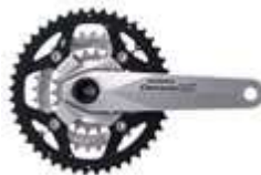
Ejemplo de biela de 3 platos