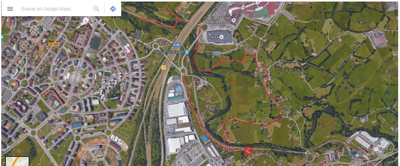
Imagen 2 - Unión con La Corredoria y con senda ciclopeatonal