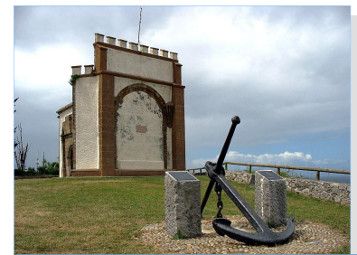
Capilla Nuestra Señora de la Guía

Así llegaremos al pueblo de Llames , donde pedalearemos en descenso hacia la playa de Guadalmía , una preciosa playa alargada entre dos desfiladeros con forma de lengua de arena que entra hacia el mar entre las rocas, donde podemos darnos el segundo baño del día. En Llames hay también una fábrica de quesos artesanales muy codiciados y con denominación de origen. En un día con marea alta y oleaje, a ambos lados de los acantilados se puede observar el espectáculo que nos ofrecen los bufones de Pría .