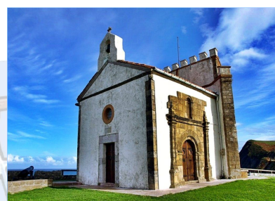
Capilla Nuestra Señora de la Guía

Ruta lineal con inicio y final en distintos puntos. El itinerario es completamente tranquilo sin apenas tráfico. Discurre por pequeñas carreteras locales, sendas y senderos de pequeño recorrido con buen firme, por lo que la ruta es apta para todo tipo de bicicletas. Hay rutas muy bellas en Asturias, las hay realmente preciosas... y luego tenemos esta ruta que os pasamos a describir. Es corta y sencilla, pues la idea es ir haciendo bastantes paradas y disfrutar de los elementos culturales, del paisaje, la sidra y la gastronomía. Pueden participar menores que ya tengan soltura con la bicicleta (a partir de los 10-11 años). ¡Ojo! La distancia no es larga pero estamos en la costa y hay mucho “sube y baja”.