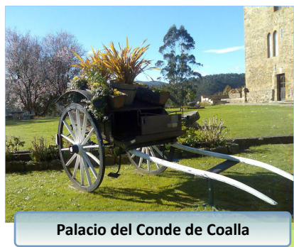
Palacio del Conde de Coalla

de Grado que saqueó e incendió Gonzalo de Peláez, Conde de Coalla , en el siglo XII).