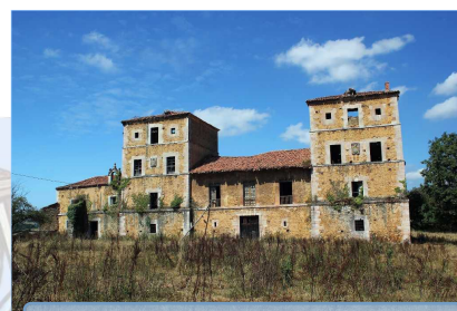
Palacio de Villanueva (San Cucao)

Partimos de Lugo de Llanera y, entre amplias praderas, caserías y modernas e intrusas urbanizaciones y similares, pedaleamos, pasando por San Cucao y su castillo o Casa de la Torre . Subimos el alto de Santa Cruz y bajamos, ya por el concejo de Las Regueras , hasta el histórico punto de Peñaflor , cruzando el río Nalón y entrando en Grado por el Camino de Santiago (la Puebla