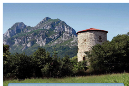
Torre de los Tuñón

A a través del desfiladero de Peñasjuntas seguiremos hasta Teverga, concejo ubicado ya en plena cordillera. En San Martín, capital del concejo, nos encontraremos con la Colegiata de San Pedro, iglesia románica del s.X, monumento nacional. En el interior además de otras imágenes, existe una talla de Cristo de finales del s.XIII. En un recinto de la misma se puede ver un pequeño museo y cuerpos momificados del Marqués de Valdecarzana y su hijo. Además tenemos otros atractivos que, si bien no será posible visitarlos en esta ocasión, conviene darles un repaso: parque de la Prehistoria, cueva Huerta, hayedo de Montegrande y puertos de Marabio y de S. Lorenzo.