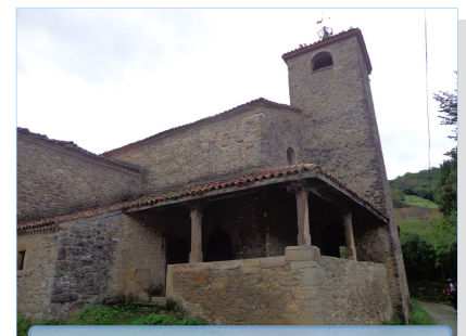
Ermita Santa Eulalia (Doriga)

En un principio, el nombre de esta ruta fue ideado porque nada más pasar el pueblo de Pravia , nos encontramos con el pueblo de Agones , donde en una casa particular se podía visitar un singular jardín con todo tipo de plantas y árboles , pero que en la actualidad permanece cerrado.