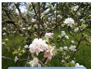
Manzano en flor

La ruta sigue, alzándose a nuestro lado el pico Fario , con sus antenas, y si nos desviamos un poco podemos visitar un templo en las alturas, el de Santa María de Nárzana , con unos capiteles y un pórtico de gran belleza.