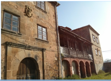
Palacio de Vigil de Quiñones o Del Moral

alberga la sede de la Mancomunidad de La Comarca de la Sidra y una capilla en honor a la Virgen del Carmen .