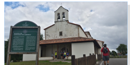
Iglesia Santiago El Mayor (Sariego)

Moral , capital saregana hasta la tercera década del s. XIX, es un lugar habitado desde el paleolítico, como así lo demuestra, entre otros yacimientos arqueológicos, el de La Pumará, donde se ha localizado la meta de un molino. Posteriormente fue el lugar elegido para hacer una carta puebla concedida por el rey Alfonso X el Sabio, aunque finalmente denegada en 1272, por la influencia de los monasterios de Valdediós y San Pelayo, muy cercanos, también, a esta ruta. De su pasado persiste el palacio de Vigil de Quiñones , y su capilla de San Roque anexa. Este palacio responde a la tipología tan difundida en Asturias, desde finales del siglo XVI, de cuerpo central flanqueado por dos torres, que poseen un piso más de altura. En la actualidad tiene un uso agropecuario y un mal estado de conservación generalizado que no logran, sin embargo, ocultar su majestuosidad. Dice una leyenda que el “ diñu burlón ” entró en una de sus viviendas y que se dedicó a hacer tantas trastadas que sus moradores decidieron cambiar de domicilio. Cuando habían cargado todas sus cosas en el carro e iban a mitad de camino, preguntó el marido a la mujer: “¿ Quedaríanos el riestru en casa? ” A lo que desde el carro se oyó: “ Non vos preocupar, tráigolu yo aquí ”.