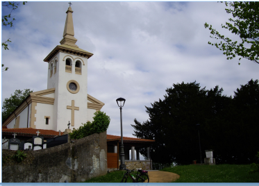
Iglesia de San Cucao

Se pasa junto al Centro ecuestre El Asturcón y aquí se da una vuelta por la senda fluvial que lo bordea -la ribera del Nora - volviendo de nuevo a la carretera. En la zona de Llanera hay múltiples instalaciones ecuestres donde viven y entrenan caballos y yeguas. Antes de poner rumbo hacia San Cucao se puede visitar la Torre de los Valdés .