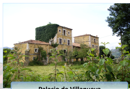
Palacio de Villanueva

En esta ruta, se da una pequeña vuelta por el concejo de Llanera, corazón de Asturias. A pesar del nombre del concejo este no es llano, tiene muchas subidas y bajadas. Esta ruta sale de Lugo de Llanera en dirección a Posada de Llanera , capital del concejo, utilizando una senda peatonal y ciclista. Antes de llegar a esta población, hay que desviarse para transitar por una carretera secundaria en dirección a Cayés y posteriormente a Ables .