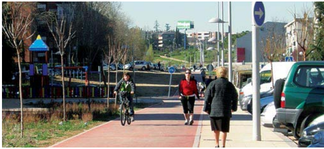
Fig. 4. La acera, insuficiente, en la posición en la que debería situarse la vía ciclista.