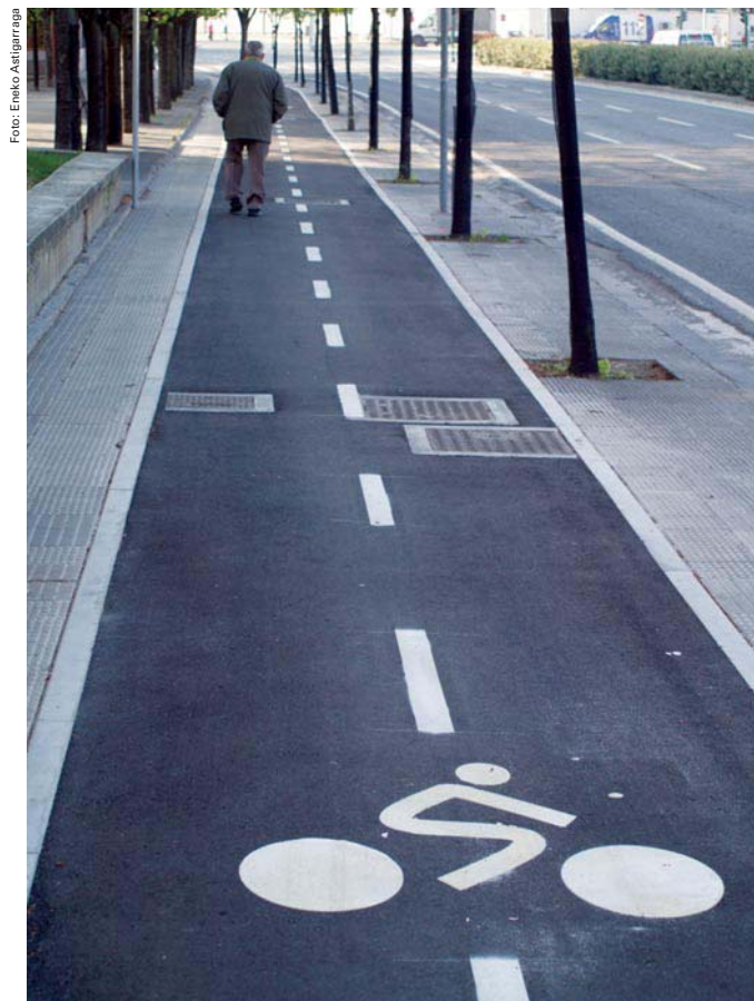
Fig. 5. Tres carriles de tráfico motorizado y la vía ciclista contra los viandantes.

Las características técnicas de las vías ciclistas también pueden inducir en ocasiones una fricción innecesaria con los viandantes, por ejemplo, mediante el recurso excesivo a vías bidireccionales (con circulación ciclista en ambos sentidos), que tienden a fomentar una lógica peatonal del ciclista y alejarlo de la lógica circulatoria normal. Las vías bidireccionales, además, suponen dificultades añadidas para un diseño adecuado de los cruces peatonales y ciclistas, y la creación de un mayor efecto barrera para los viandantes.