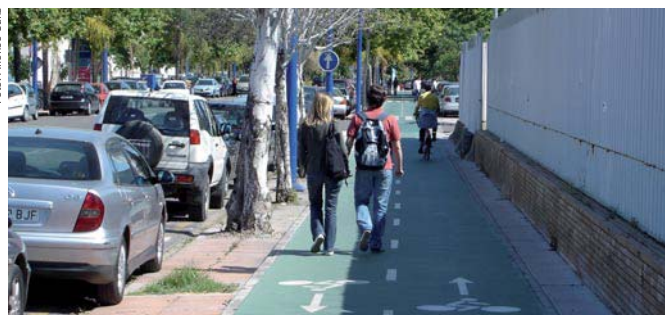
Fig. 3. El conflicto ciclista-viandante está servido, mientras que el aparcamiento ilegal se mantiene.