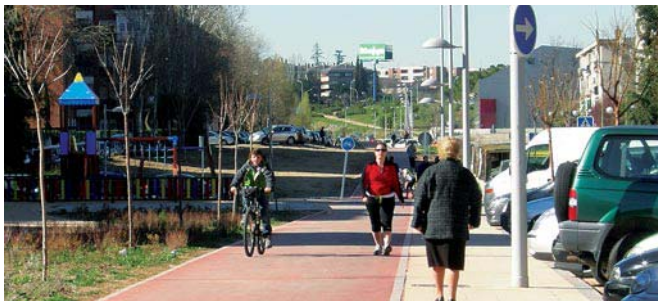
Fig. 4. La acera, insuficiente, en la posición en la que debería situarse la vía ciclista.